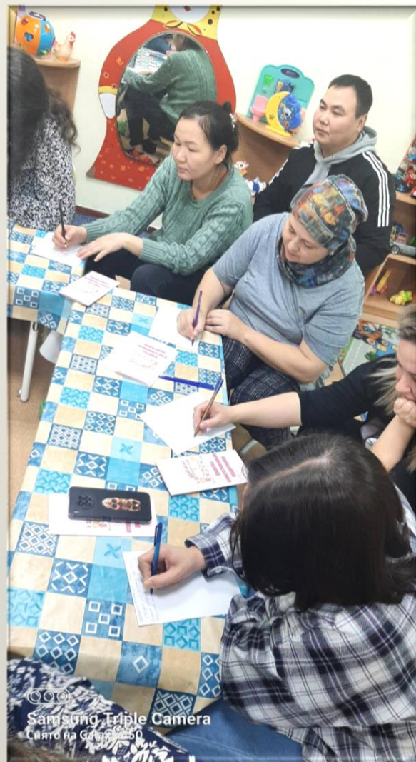
☺☺☺ Samsung Triple Camera Снято на Galaxy A50