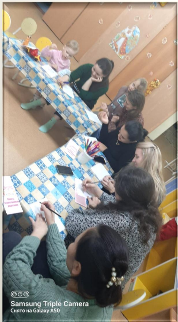
☺☺☺ Samsung Triple Camera Снято на Galaxy A50