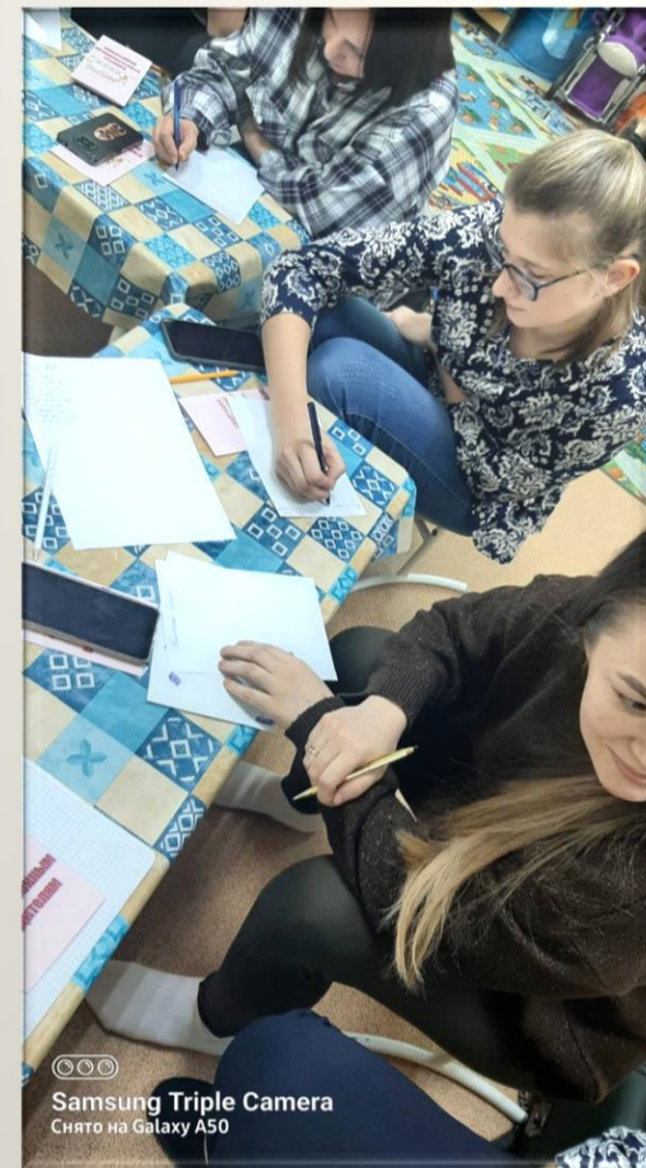
☺☺☺ Samsung Triple Camera Снято на Galaxy A50